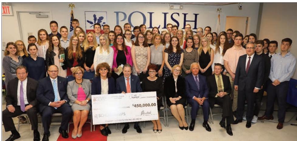
Laureaci Programu Stypendialnego PSFCU podczas ceremonii na nowojorskim Greenpoincie

Kolejna edycja Programu Stypendialnego Polsko-Słowiańskiej Federalnej Unii Kredytowej zakończona: w tym roku PSFCU nagrodziła 388 młodych Członków Naszej Unii przeznaczając na stypendia 450 tys. dolarów. Od początku Programu Stypendialnego w 2001 r. skorzystało z niego łącznie prawie cztery tysiące osób a suma stypendiów wyniosła prawie 4,5 mln dolarów.