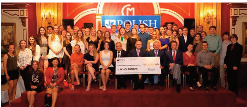
Ceremonia wręczenia stypendiów PSFCU w stanie New Jersey