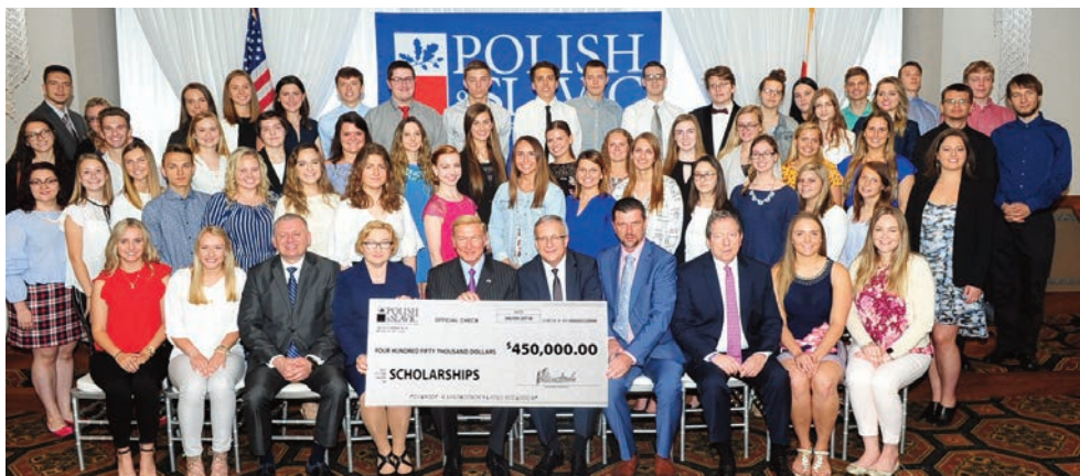
Laureaci stypendiów PSFCU w stanie Illinois

m.in. zaangażowanie młodzieży w działalność organizacji, parafii, szkół doskonalących i klubów polonijnych.