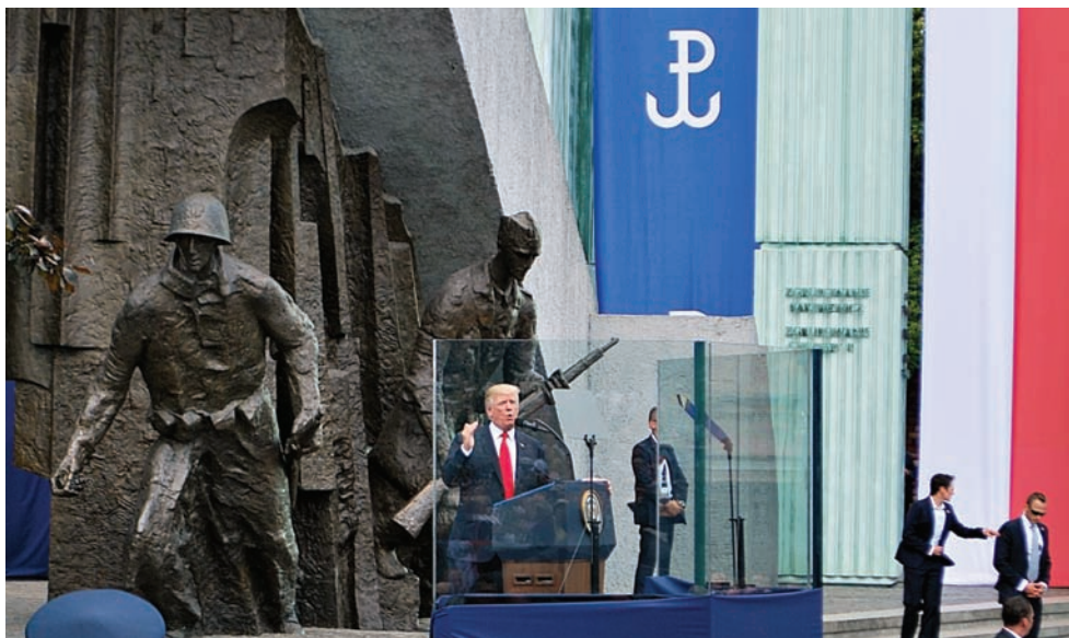
Prezydent USA Donald Trump podczas przemówienia przed pomnikiem Powstania Warszawskiego