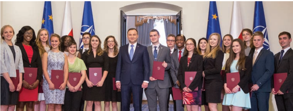
Spotkanie amerykańskich studentów z Prezydentem RP Andrzejem Dudą w Pałacu Prezydenckim

Spotkaniem z prezydentem RP Andrzejem Dudą zakończyła się 10-dniowa wizyta w Polsce dwadzieścioro studentów ze Stanów Zjednoczonych. To laureaci pierwszej edycji programu stypendialnego Polsko-Słowiańskiej Federalnej Unii Kredytowej (PSFCU) organizowanego we współpracy z концерном General Electric przez Kancelarię Prezydenta RP Andrzeja Dudy.