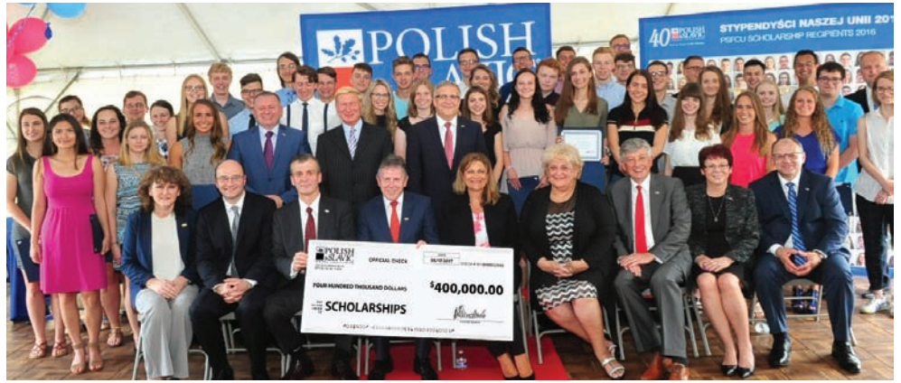
Laureaci programu stypendialnego PSFCU podczas ceremonii w Bridgeview, IL

W tym roku uroczyste wręczenie stypendiów odbyło się oddzielnie w trzech stanach, gdzie obecna jest Nasza Unia. Uroczystość wręczenia stypendiów dla stanu Nowy Jork odbyła się 14 czerwca w siedzibie Naszej Unii na Greenpoincie, a stypendyści z New Jersey odebrali nagrody 15 czerwca w Centrum Operacyjnym PSFCU w Fairfield, New Jersey. Nagrodzeni ze stanu Illinois