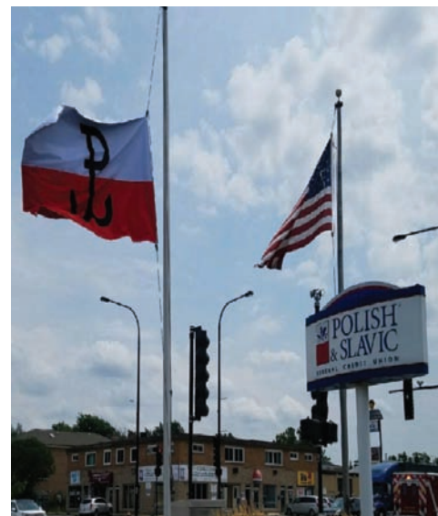
Flaga przy oddziale PSFCU w Bridgeview

Flaga z symbolem Polski Walczącej powiewa przed siedzibą Polsko-Słowiańskiej Federalnej Unii Kredytowej już drugi rok z rzędu. Podobnie jak flaga wywieszona przed oddziałem PSFCU w Bridgeview na przedmieściach Chicago, przez 63 dni będzie przypominać o bohaterstwie i tragedii Powstania Warszawskiego.