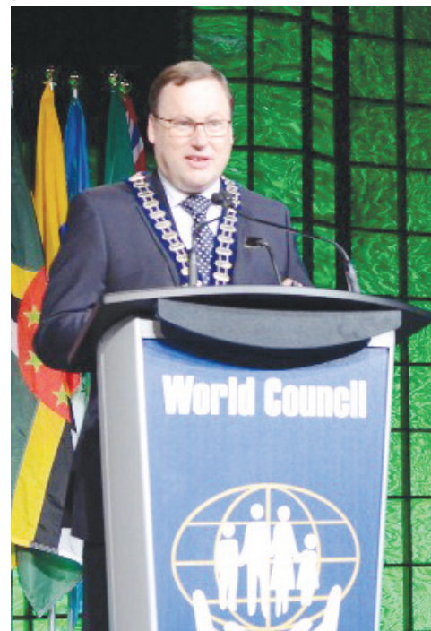
Senator Bierecki po wyborze na przewodniczącego WOCCU w 2013 r.

W dorocznym zjeździe Światowej Rady Unii Kredytowych wzięło w tym roku udział ponad 1 600 delegatów z 58 krajów. Przez trzy lipcowe dni dyskutowali we Wiedniu m.in. o najnowszych trendach i rozwoju technologicznym w sektorze finansowym oraz sposobach na zwiększenie członkostwa ludzi młodych w uniach kredytowych.