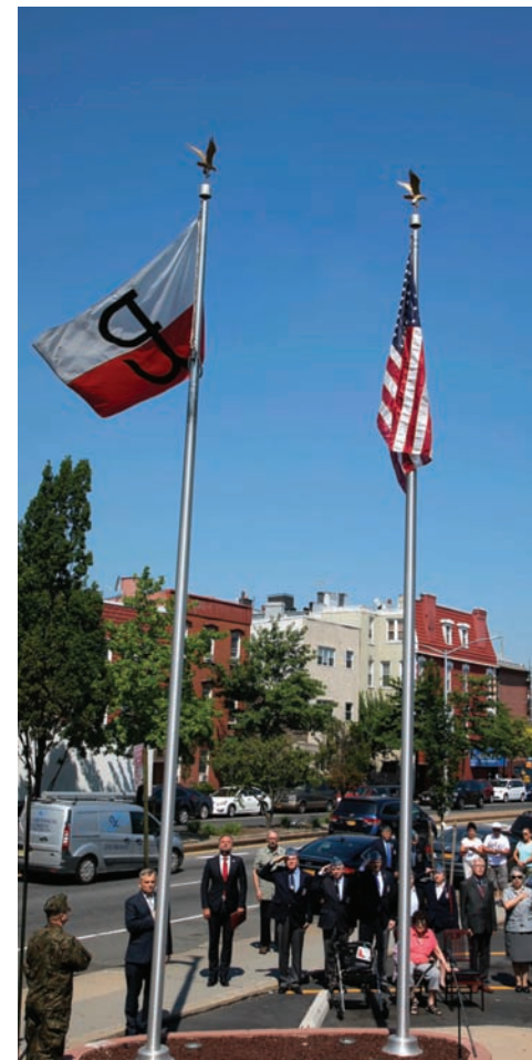
Flaga z symbolem Polski Walczącej przed siedzibą PSFCU

Na uroczystości byli obecni także harcerze, członkowie SWAP i innych organizacji polonijnych, pracownicy PSFCU oraz mieszkańcy Greenpointu.